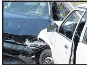
Verdachte schade lopen al gaw in de gaten. Boven: de situatie na de fatale aanrijding in Erp.

Agenten zien soms bij het opstellen van een proces-verbaal al of een aangifte vals is. In andere gevallen komen verdachte claims op de afdeling fraudezaken van de verzekeraar terecht.